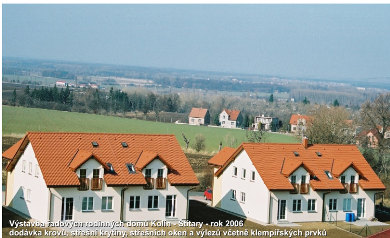
Výstavba řadových rodinných domů Kolín - Štítary - rok 2006 dodávka krovů, střešní krytiny, střešních oken a výlezu včetně klempířských prvků