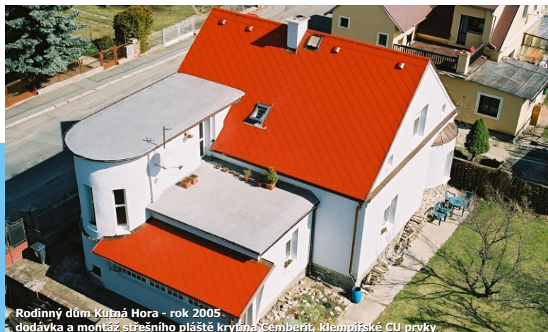
Rodinný dům Kutná Hora - rok 2005 dodávka a montáž střešního pláště krytina Cembit, klempířské CU prvky