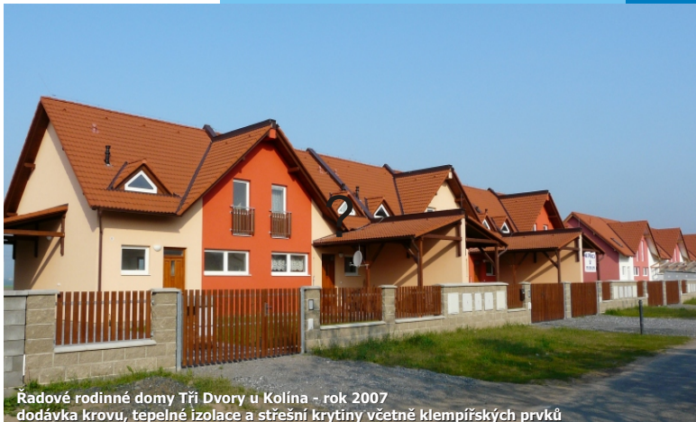
Řadové rodinné domy Tři Dvory u Kolína - rok 2007 dodávka krovu, tepelné izolace a střešní krytiny včetně klempířských prvků