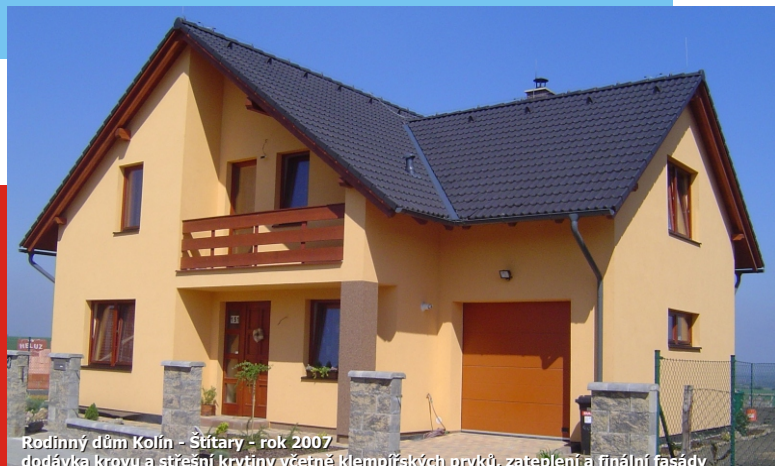
Rodinný dům Kolín - Štítary - rok 2007 dodávka krovu a střešní krytiny včetně klempířských prvků, zateplení a finální fasády