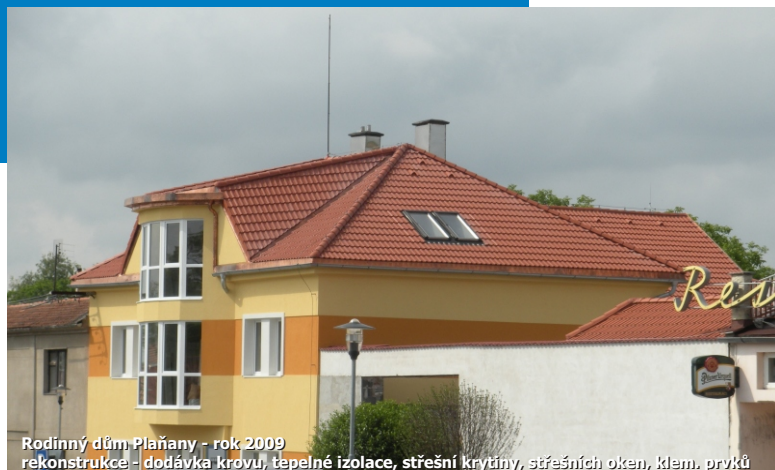
Rodinný dům Plaňany - rok 2009 rekonstrukce - dodávka krovu, tepelné izolace, střešní krytiny, střešních oken, klemp. prvků