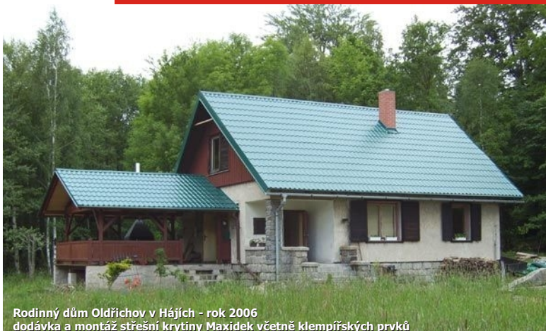
Rodinný dům Oldřichov v Hájích - rok 2006 dodávka a montáž střešní krytiny Maxidek včetně klempířských prvků