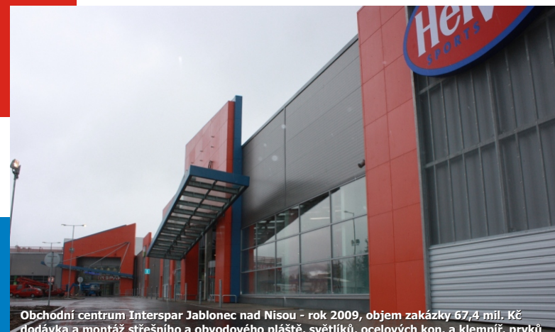
Obchodní centrum Interspar Jablonec nad Nisou - rok 2009, objem zakázky 67,4 mil. Kč dodávka a montáž střešního a obvodového pláště, světlíků, ocelových kon. a klempíř. prvků