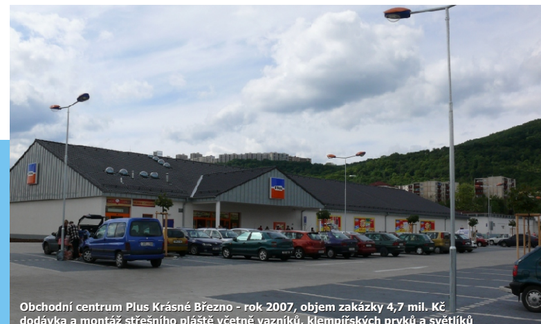
Obchodní centrum Plus Krásné Březno - rok 2007, objem zakázky 4,7 mil. Kč dodávka a montáž střešního pláště včetně vazníků, klempířských prvků a světlíků