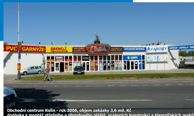
Obchodní centrum Kolín - rok 2006, objem zakázky 3,6 mil. Kč dodávka a montáž střešního a obvodového pláště, ocelových konstrukcí a klempířských prvků