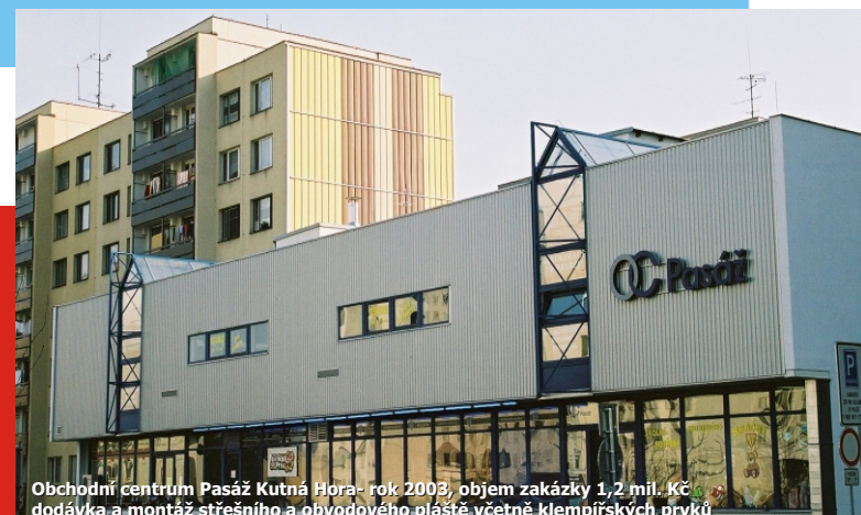
Obchodní centrum Pasáž Kutná Hora - rok 2003, objem zakázky 1,2 mil. Kč dodávka a montáž střešního a obvodového pláště včetně klempířských prvků