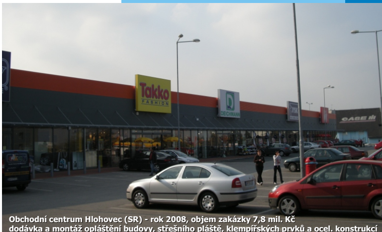
Obchodní centrum Hlohovec (SR) - rok 2008, objem zakázky 7,8 mil. Kč dodávka a montáž opláštění budovy, střešního pláště, klempířských prvků a ocel. konstrukcí