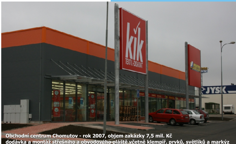
Obchodní centrum Chomutov - rok 2007, objem zakázky 7,5 mil. Kč dodávka a montáž střešního a obvodového pláště včetně klempíř. prvků, světlíků a markýz