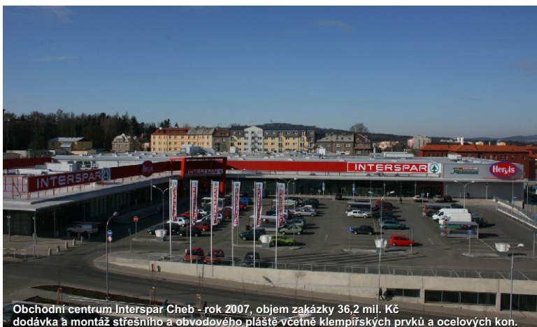
Obchodní centrum Interspar Cheb - rok 2007, objem zakázky 36,2 mil. Kč dodávka a montáž střešního a obvodového pláště včetně klempířských prvků a ocelových kon.